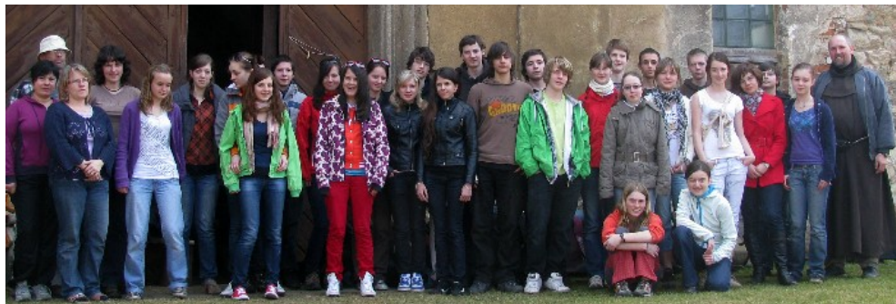
JESENICE u Rakovníka