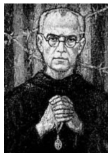
Sv. Maxmilián Kolbe