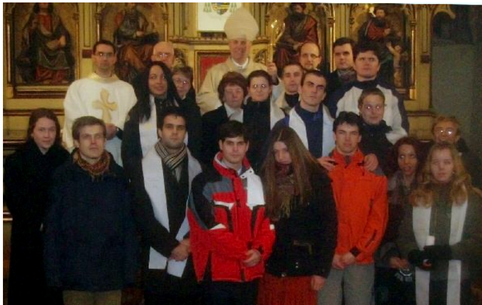
Novokřtění s kmotry o velikonoční vigílii v katedrále sv. Bartoloměje 22. března 2008