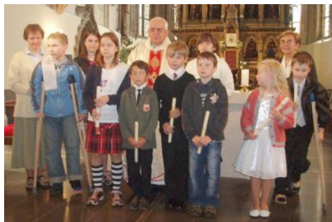
První svaté přijímání a křest dětí 13. 5. 2007