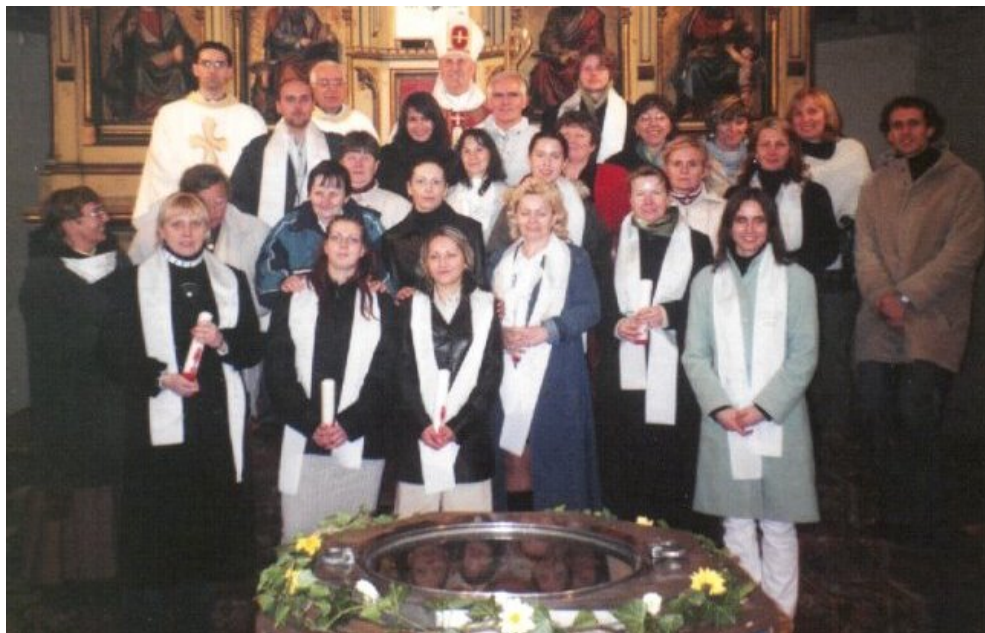
Z Velikonoční vigílie 7. 4. 2007 v katedrále — viz str. 5