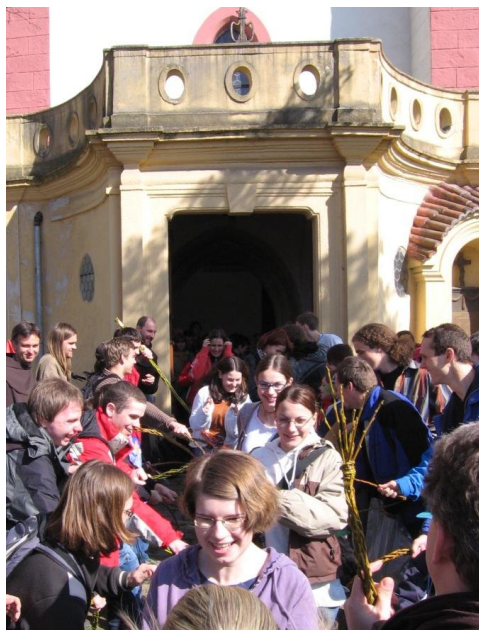
Tradiční velikonoční koledování na Roudné