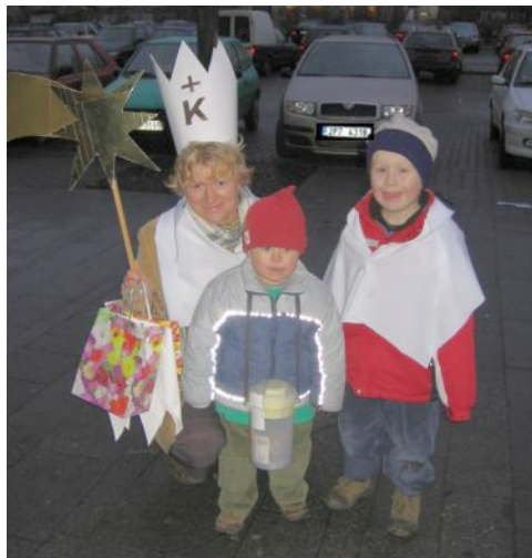
Připojili jsme se ke tříkrálové sbírce.